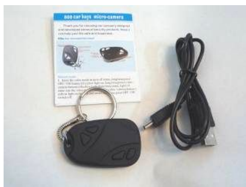
カメラ本体・説明書・USB ケーブル